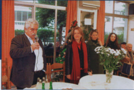
Αξιολόγηση μήνιμης ΔΙ ΚΑΠΗ