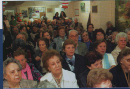
Αξιολόγηση μήνης ΒΙ ΚΑΠΗ