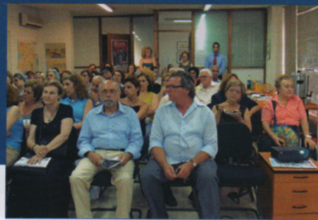
Μαθήματα εθελοντών βοηθών υγείας

Με το εξειδικευμένο προσωπικό του ΚΕ.Κ.Υ.Π., γίνονται δωρεάν τέστ αξιολόγησης μνήμης σε όλα τα ΚΑΠΗ του Δήμου. Μέχρι τώρα εξετάστηκαν περίπου 200 άτομα. Σε όσους διαπιστώνεται πρόβλημα συστήνεται να απευθυνθούν σε ειδικό γιατρό.