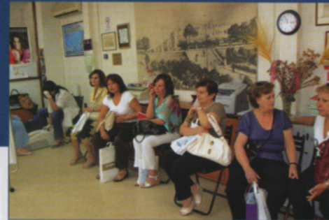
Δωρεάν εξέταση οστεοπόρωσης

θέματα Ψυχοκοινωνικής στήριξης, Συμβουλευτικής απασχόλησης, Επαγγελματικού Προσανατολισμού, Πληροφόρηση για τις υπηρεσίες Κοινωνικής Πρόνοιας, Πληροφόρηση για τα δικαιώματα των πολιτών και ενημέρωση για θέματα ισότητας. Όλες αυτές οι υπηρεσίες παρέχονται, όταν απαιτηθεί και από τηλεφώνου ως επικοινωνία «ανοιχτής γραμμής».