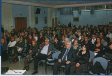
Εκδήλωση για ημέρα εθελοντισμού