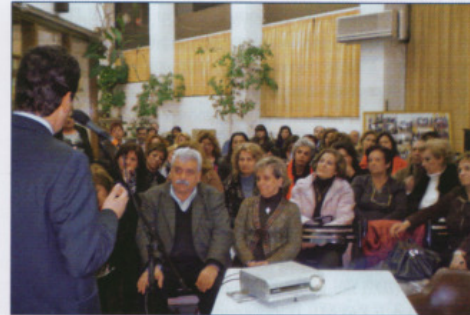
Εκδήλωση Α' Δημ. Διαμερίσματος

Η ΚΟ.Δ.Ε.ΚΟ.ΜΕ.Π., έχει καθιερώσει εβδομαδιαία Σεμινάρια Εκπαίδευσης Εθελοντών Βοηθών Υγείας, τρίμηνης διάρκειας, στην αίθουσα του Β' Δημοτικού Διαμερίσματος. Εκπαιδευτές είναι γιατροί, καθηγητές Νοσηλευτικής, καθώς και ναυαγοσώστες της Πανελληνίας Σχολής Ναυαγοσωστικής.