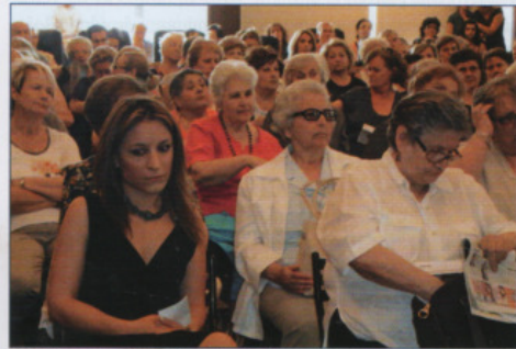
Εκδήλωση στην αίθουσα Δημ. Συμβουλίου